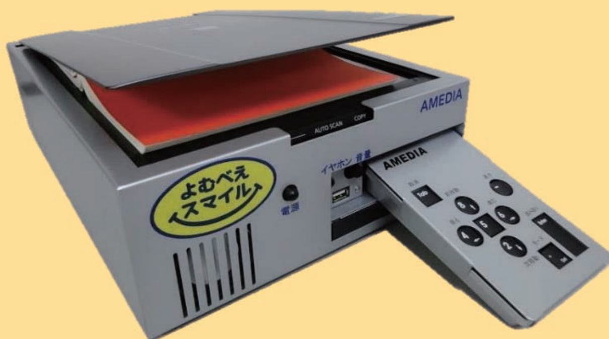
活字文書読上げ装置