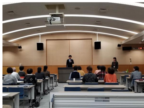
午後の部 音訳研修会の様子