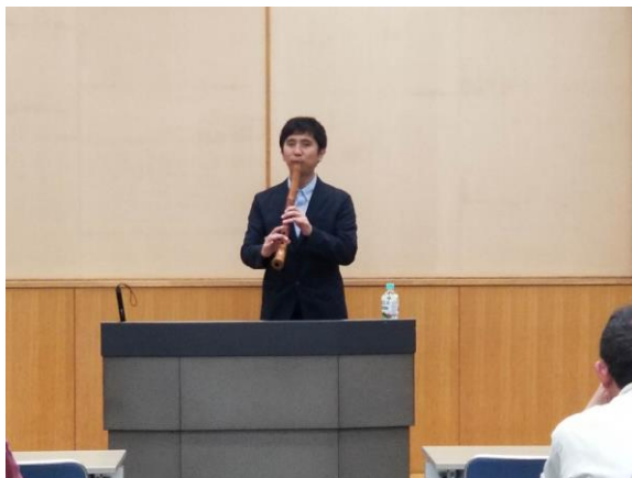
午前の部 最後に披露された講師による 尺八の演奏