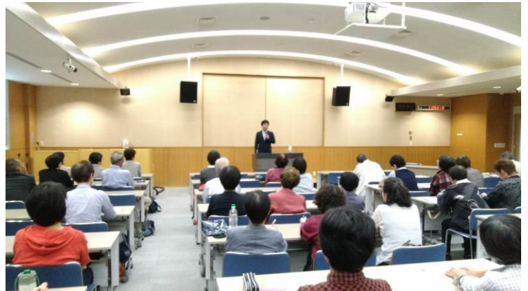
午前の部 全体研修会の様子