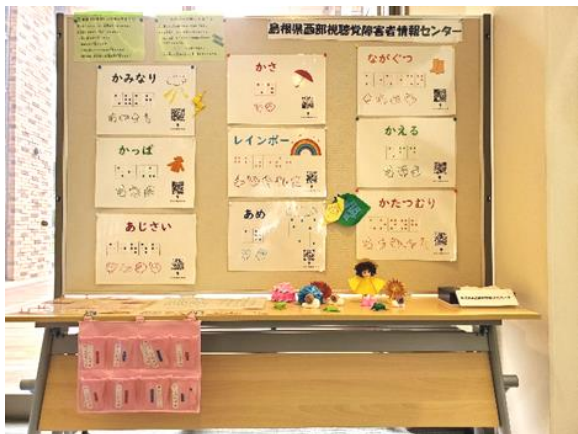
てんじしょうかい 点字紹介パネルの写真

これをきっかけに、点字や指文字・手話に興味を持ってもらえると嬉しいです。今後もこのような啓発展示をさせていただこうと思います。