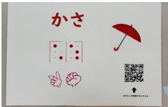
てんじ ゆびもじ しょうかい 点字・指文字紹介ボードの写真