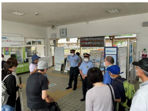
えきちやう はなし き 駅長から話を聞いている写真

さいご こま とき かいさつちか お しょういん よ おし 最後に、困った時には、改札近くにある、インターホンを押して、職員を呼ぶことも教えていただきました。