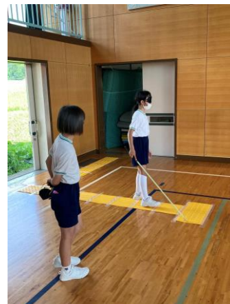
はくじやう も てんじ アイマスクをして白杖を持ち、点字プロ うえ ある ようす ックの上を歩いている様子