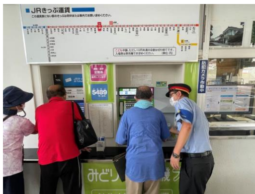
けんばいき さわ せつめい う 券売機に触りながら説明を受けている写真