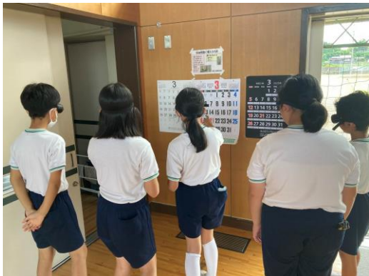
じゃくしたいけんめがね 弱視体験眼鏡をかけてカレンダーを み ようす 見ている様子

かいめ じゃくしたいけん つ はくじやうたいけん てび ほこうたいけん じゃくしたいけん かいだん 1回目は、弱視体験やアイマスクを着けて白杖体験、手引き歩行体験をしました。弱視体験では、階段 のぼ お こわ て てばな お ひと げんき お い ひと の上り下りをしました。怖くて手すりを手放すことができず、ゆっくり下りた人や、元気よく下りて行った人 もいました。このような体験を通じて、手引き歩行のときには、声掛けや相手を信じることの大切さを感じ てもらいました。2回目は、子どもたちからの要望があった点字体験をする予定です。さて 3回目は、子ど もたちからどんな声があがるでしょうか？