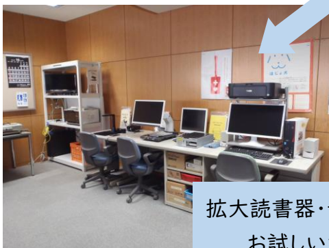
拡大読書器・音声パソコンも お試しいただけます