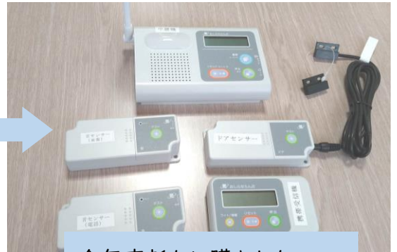
今年度新たに購入した 「おしらせランプ」

⇒情報ルームは配置や表示を見直し、補装具や日常生活用具給付対象品などをまとめました。