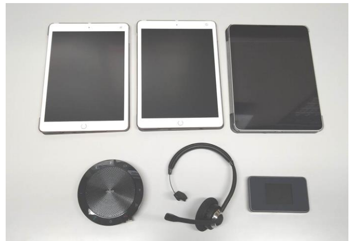
↑ 遠隔手話通信用タブレット等