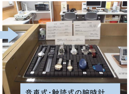
音声式・触読式の腕時計