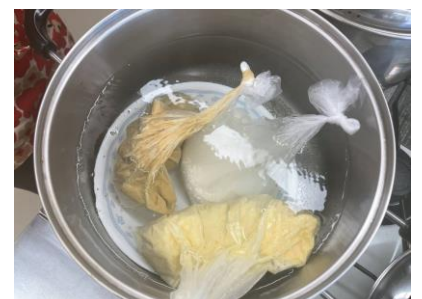
蒸しパンと一緒に鍋で湯せん