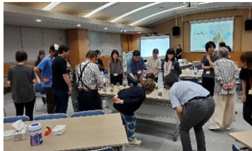
つくえ なら さくひん かんしょう 机に並べた作品をじっくり鑑賞