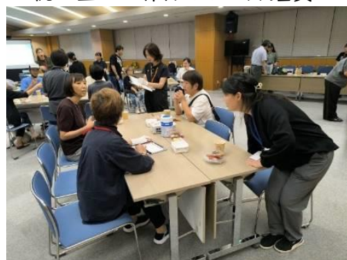
かし かんたん お菓子をつまみながらそれぞれのテーブルで歓談