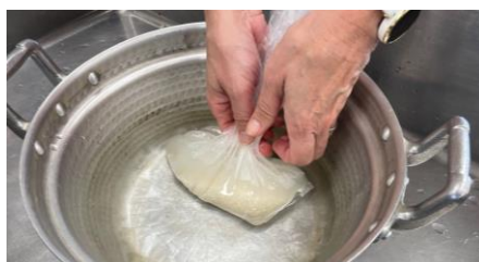
水を張った鍋に袋ごと漬けると空気が抜ける