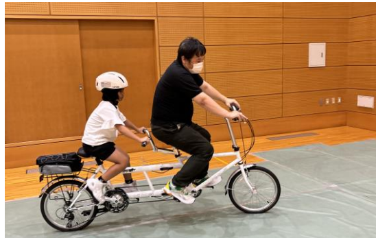
じてんしゃ しじょう ようす タンデム自転車に試乗している様子