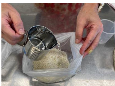
お米と水を袋に入れるだけ