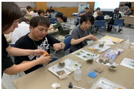
こうし いっしょ こけ 講師と一緒に苔をハサミでカット