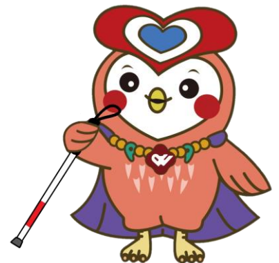
島根県社会福祉事業団マスコットキャラクター