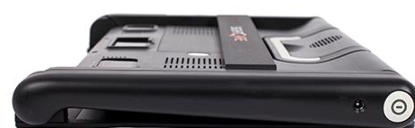
↑ 折りたたんだ状態