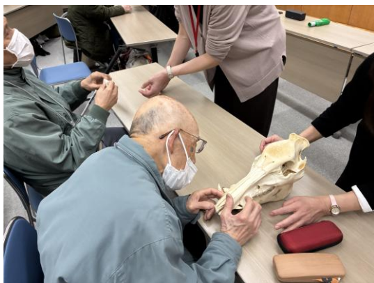
イノシシの頭の骨を触っている様子