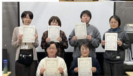
修了証を手に並んで記念撮影