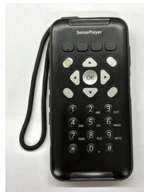
センスプレーヤー