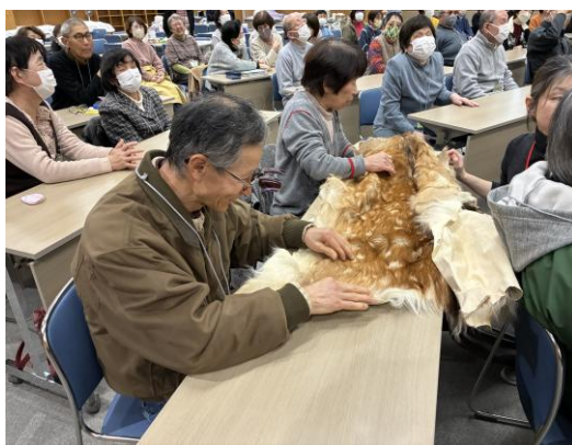
鹿の皮を触っている様子